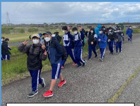
春の学鳳ウォークなど 高校生との活動や交流も