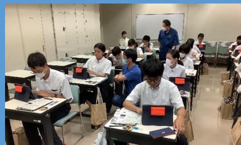
会津大学との連携授業

本校は、県内で最初に設立された併設型中高一貫教育校です。6年間の系統的指導により、「先取り学習」や「少人数指導」などの特色ある取り組みを行っております。学校公開では、本校における教育活動について概要を説明させていただきます。また、校舎案内により、施設・設備をご覧いただき、充実した学校生活についてイメージしていただきたいと思います。