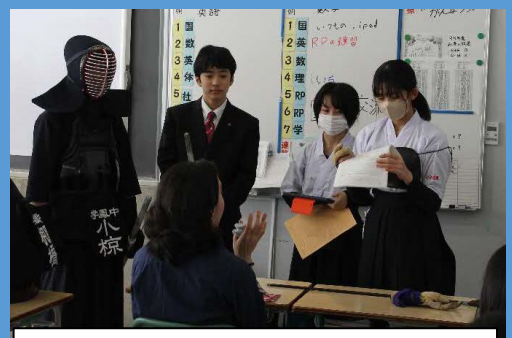
学鳳レインボープロジェクトでの国際交流 課題解決に向けた学習も充実