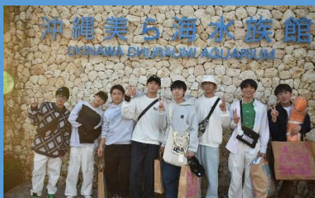
沖縄への研修旅行